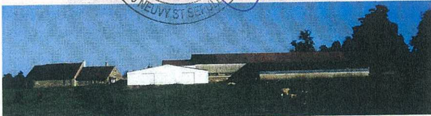
Une construction trop claire s'insère mal dans le paysage

a été signée le 20 juin 2000 sous la présidence du préfet de l'Indre.