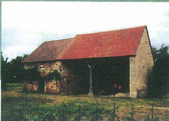
Une harmonie naturelle

Maisons paysannes et bâtiments d'exploitation témoignent d'une longue tradition constructive. Les volumes des bâtiments sont simples, les constructions nouvelles se greffent le plus souvent sans rupture avec les bâtiments existants. Les matériaux de construction d'origine minérale ou végétale sont de couleur mate et plutôt foncée. Ils s'inscrivent sans heurt dans le paysage ■